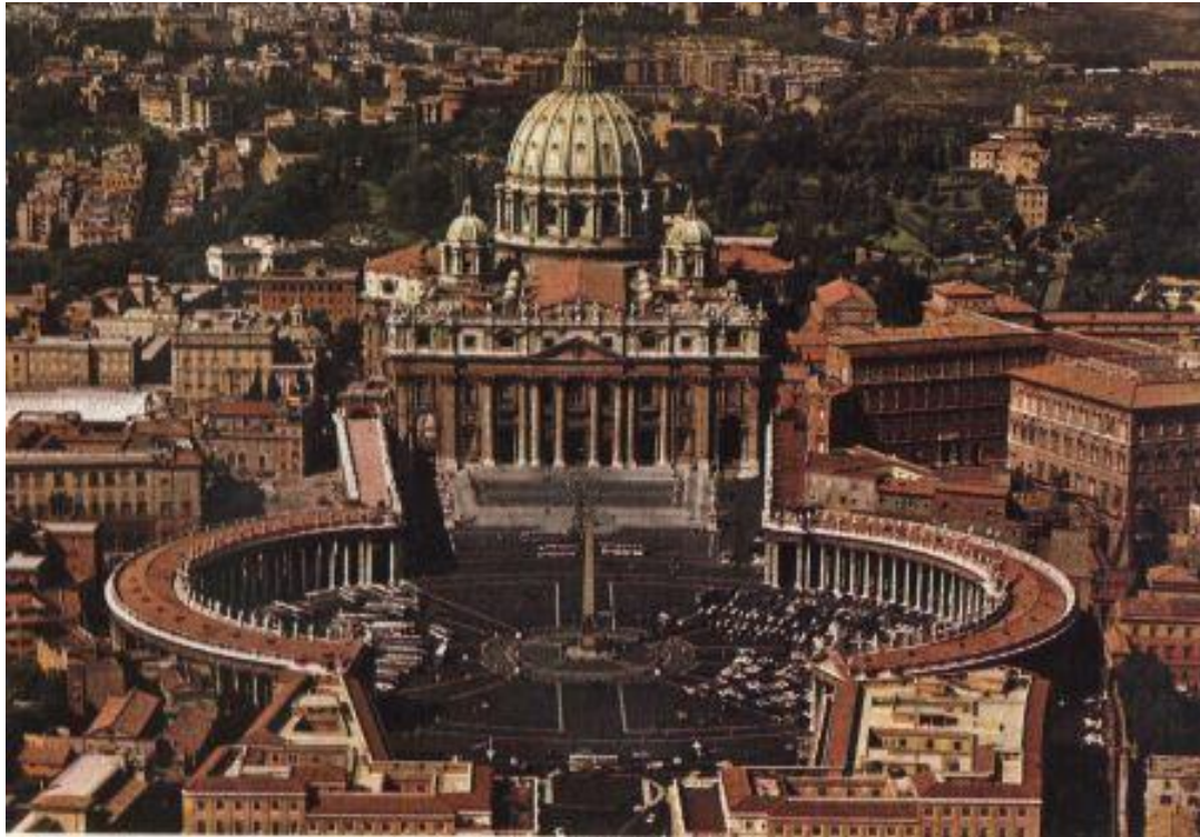
Basilique Saint-Pierre Vatican