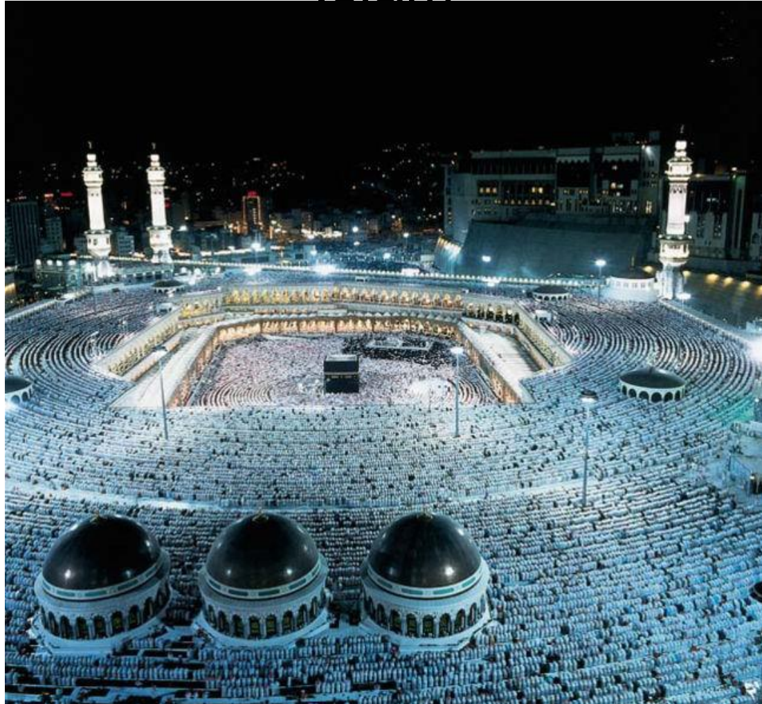
La Mecque (Arabie saoudite)