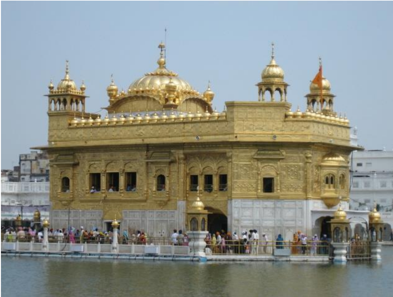
Temple d'or Amritsar en Inde