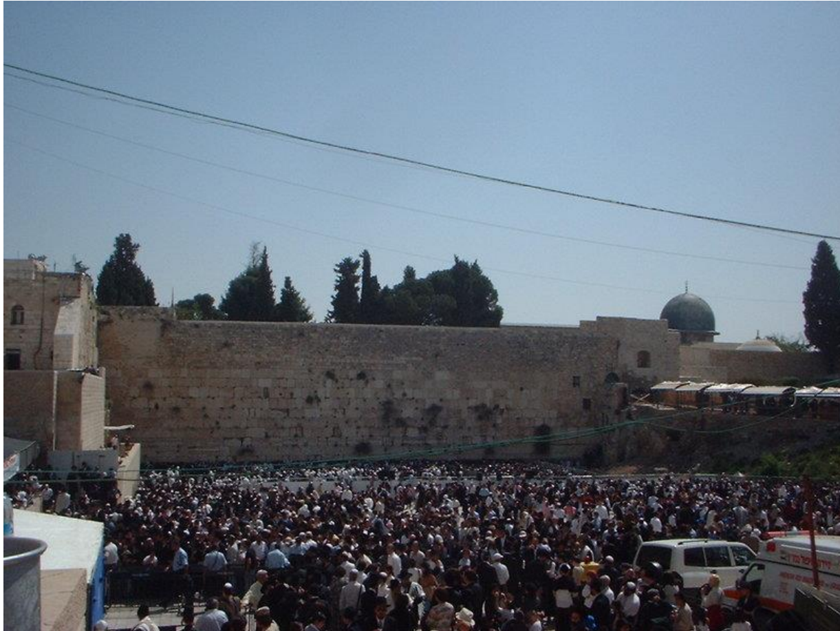
Mur des Lamentations Jérusalem