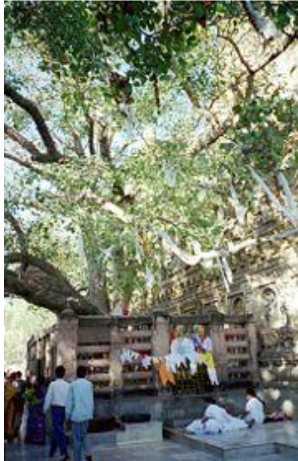
Arbre de la Bodhi (Bodh-Gaya en Inde)